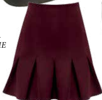
SAIA LANÇA PERFUME