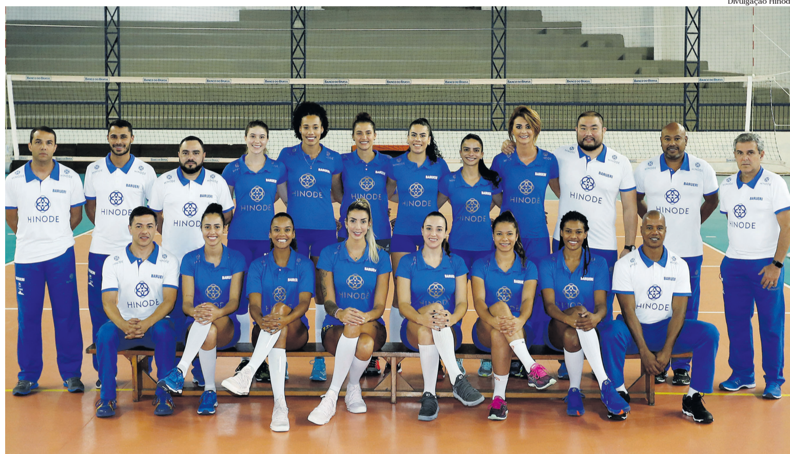
A equipe se divide entre os treinamentos no CT de Sportville e no Ginásio Poliesportivo José Corrêa, em Barueri, que é a casa do time

Seis equipes no total disputam o torneio que começa no próximo dia 6; além de Hinode Barueri, São Caetano, Valinhos, Pinheiros, Sesi Bauru e Osasco buscam o título estadual