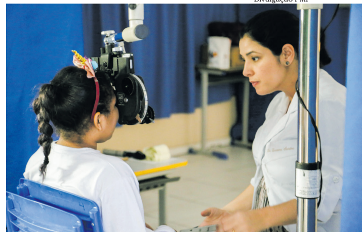
Foco da ação é colaborar com a saúde da população

Na sexta-feira (24), a Prefeitura de Itapevi e o Instituto Eurofarma realizaram mais um mutirão oftalmológico do projeto “Ampliando Horizontes”, que conta também com participação do Instituto Horas da Vida. Desta vez, estudantes do Cemeb Floriza Nunes de Camargo (Jardim Rainha) passaram pelos serviços de triagem oftalmológica. Voltada à saúde visual da população, a iniciativa tem oferecido atendimento oftalmológico à crianças e adolescentes do município.