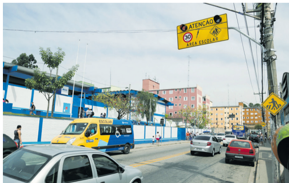
Objetivo é garantir maior segurança aos pedestres

As escolas e áreas que estão passando por melhorias são: Cemeb Manuel Bandeira (Rua Marialva, 376 - Jardim Briquet), Cemeb Bemvindo Moreira Neri (Avenida Pe-