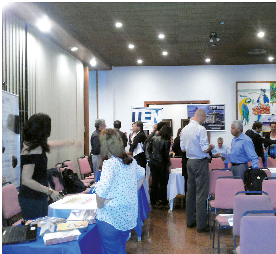
Organizadores do evento informam que as vagas são limitadas

Endereço: Rua do Senado, nº 229, Centro CEP: 20.231-020 | Tel.: 21 - 2232-4046